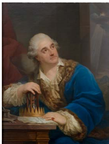
Stanislas Auguste à la clépsydre dit portrait allégorique