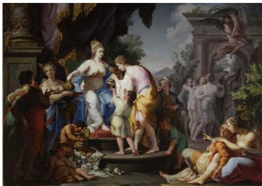
Tableau allégorique "l'Art"